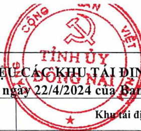
BẢNG 2- TỔNG HỢP SỐ LIỆU CÁC KHU TÁI ĐỊNH CƯ TRÊN ĐỊA BÀN TỈNH (Kèm theo Nghị quyết số 14-NQ/TU ngày 22/4/2024 của Ban Chấp hành Đảng bộ tỉnh Đồng Nai)